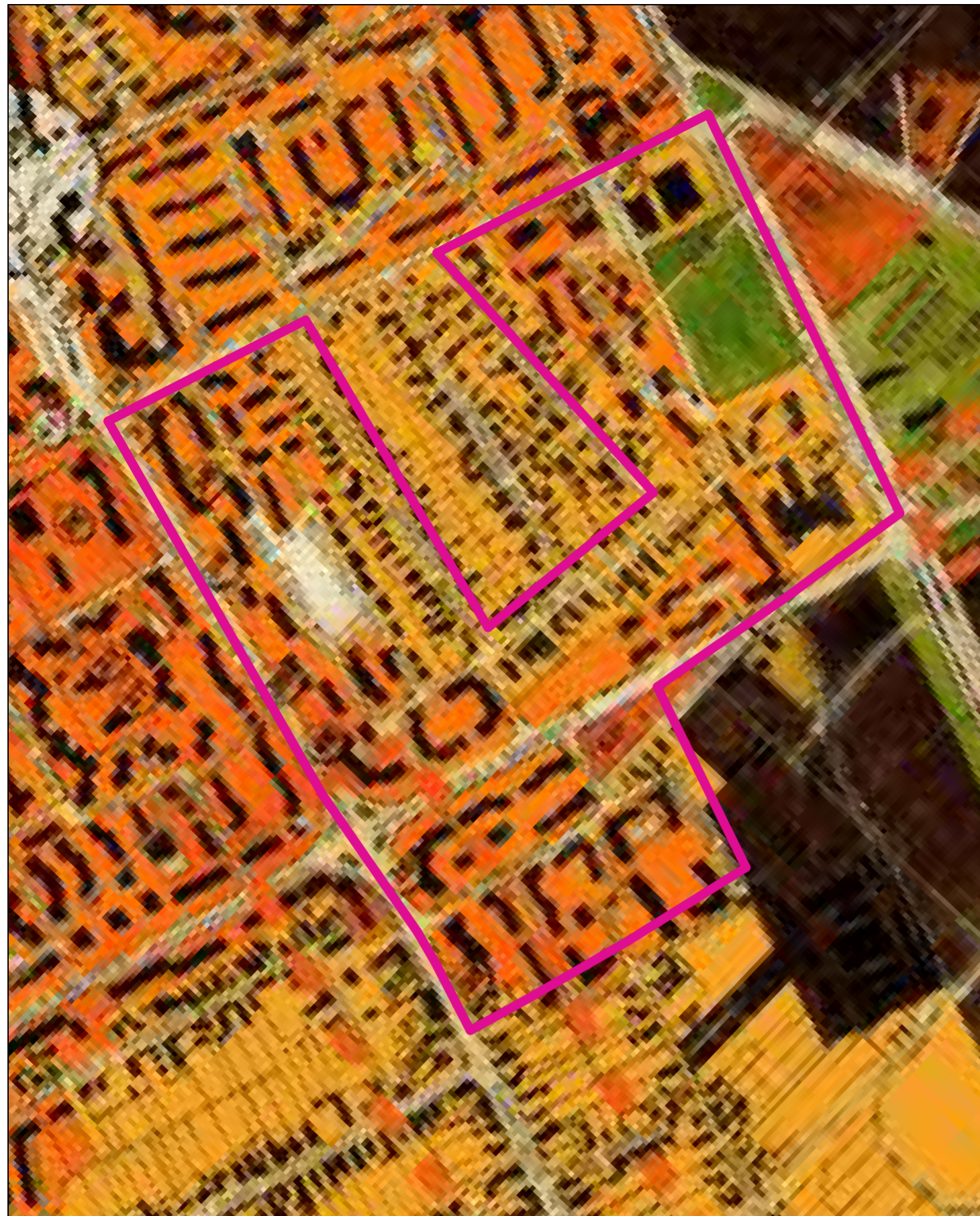
PLAN DE INCADRARE IN PUG IN VIGOARE