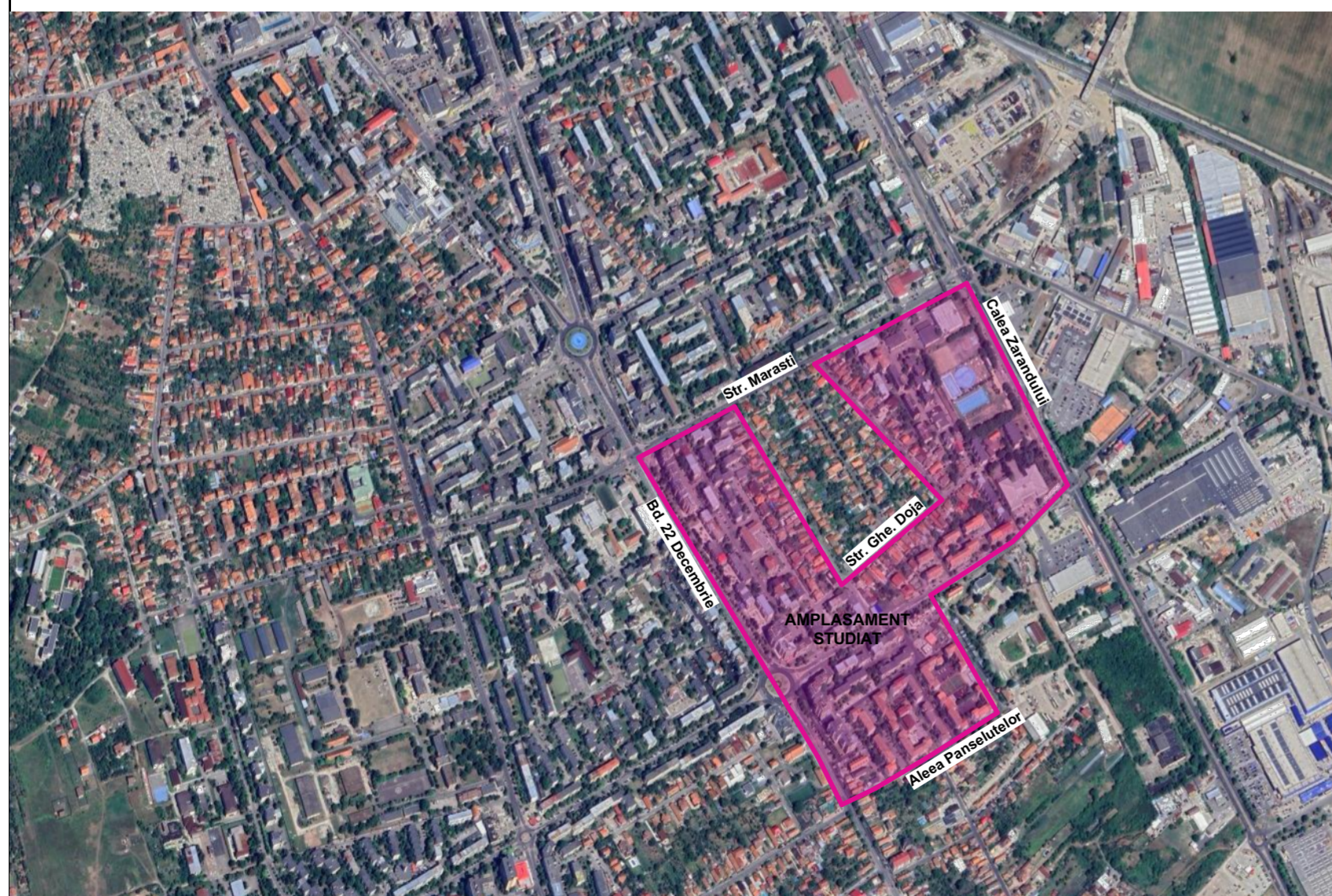
INCADRARE IN ZONA