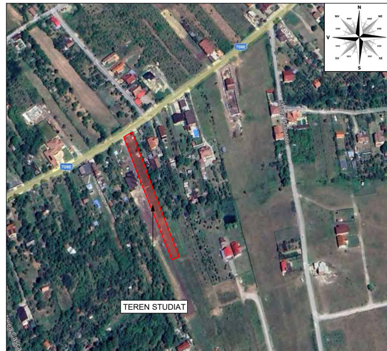
PLAN DE SITUATIE ORTOFOTOPLAN - SCARA 1:2000