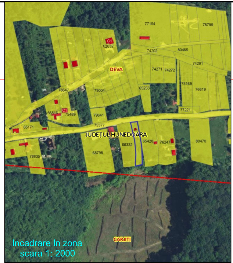
incadrare in zona scara 1: 2000