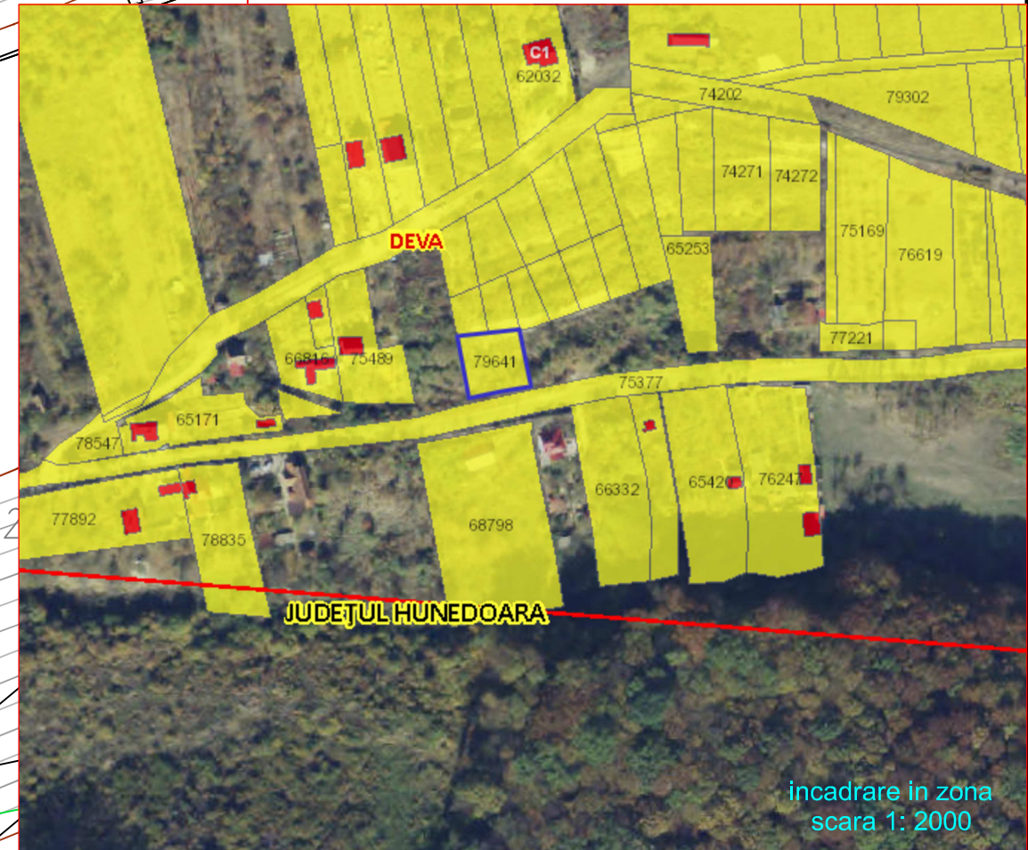
incadrare in zona scara 1: 2000