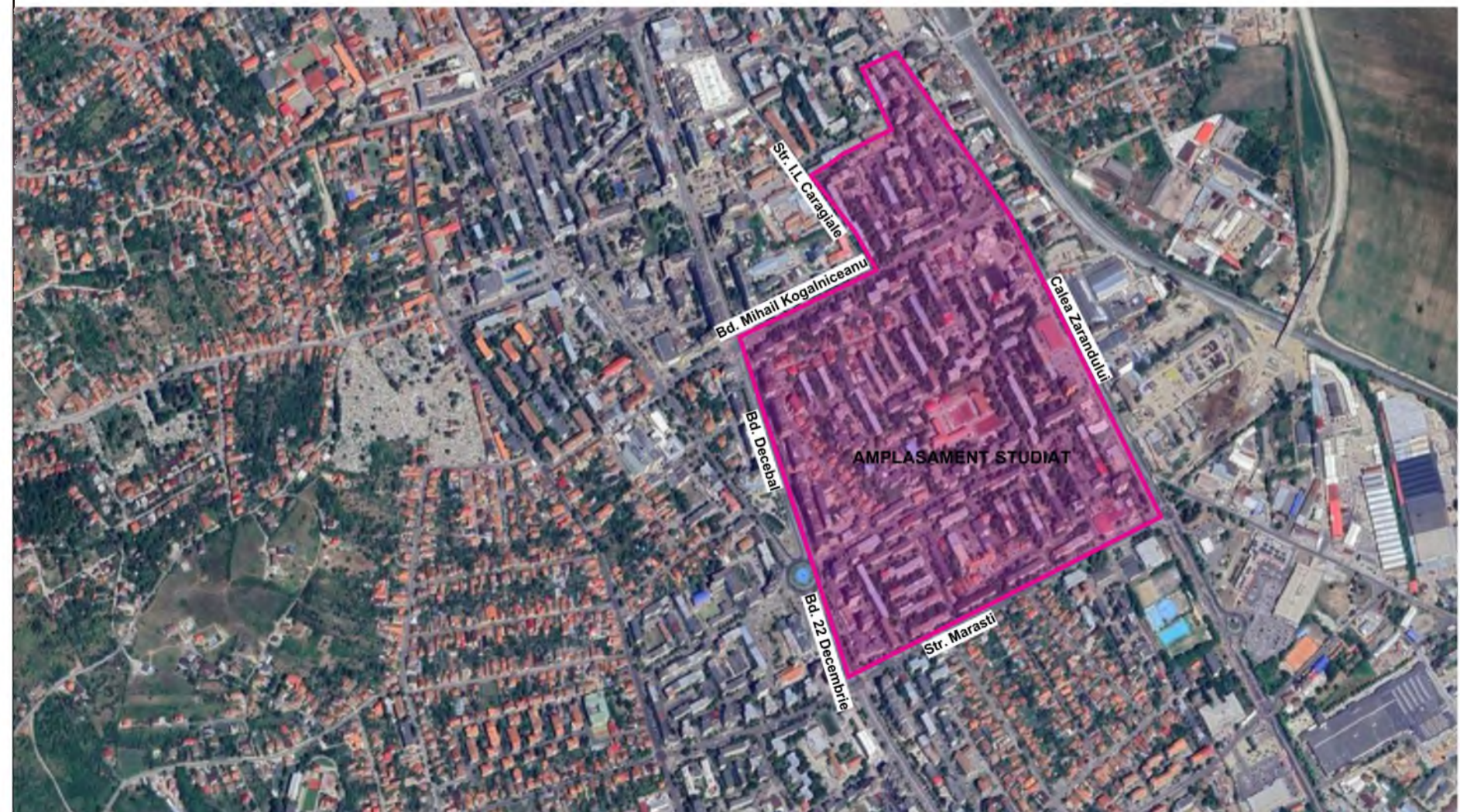
INCADRARE IN ZONA

CONFORM PUG IN VIGOARE - UTR2 - ZONA REZIDENTIALA CU CLADIRI CU MAI MULT DE 3 NIVELE, SUBZONA REZIDENTIALA LI - LOCUINTE COLECTIVE CU FUNCȚIUNI COMPLEMENTARE