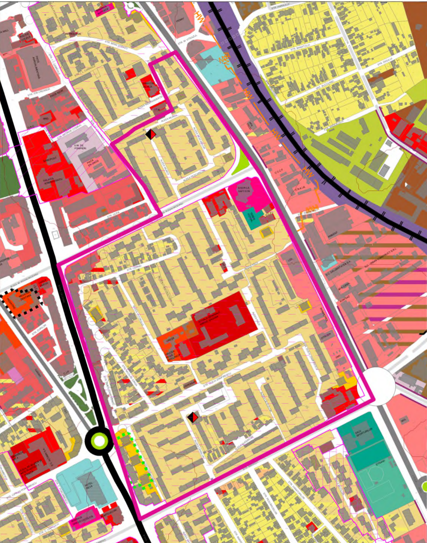
PLAN DE INCADRARE IN PUG IN LUCRU (CU ZONE PROPUSE PENTRU RESTRUCTURARE)