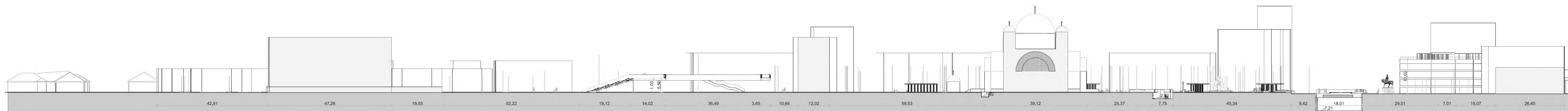
SECȚIUNE LONGITUDINALĂ SCARA 1:700