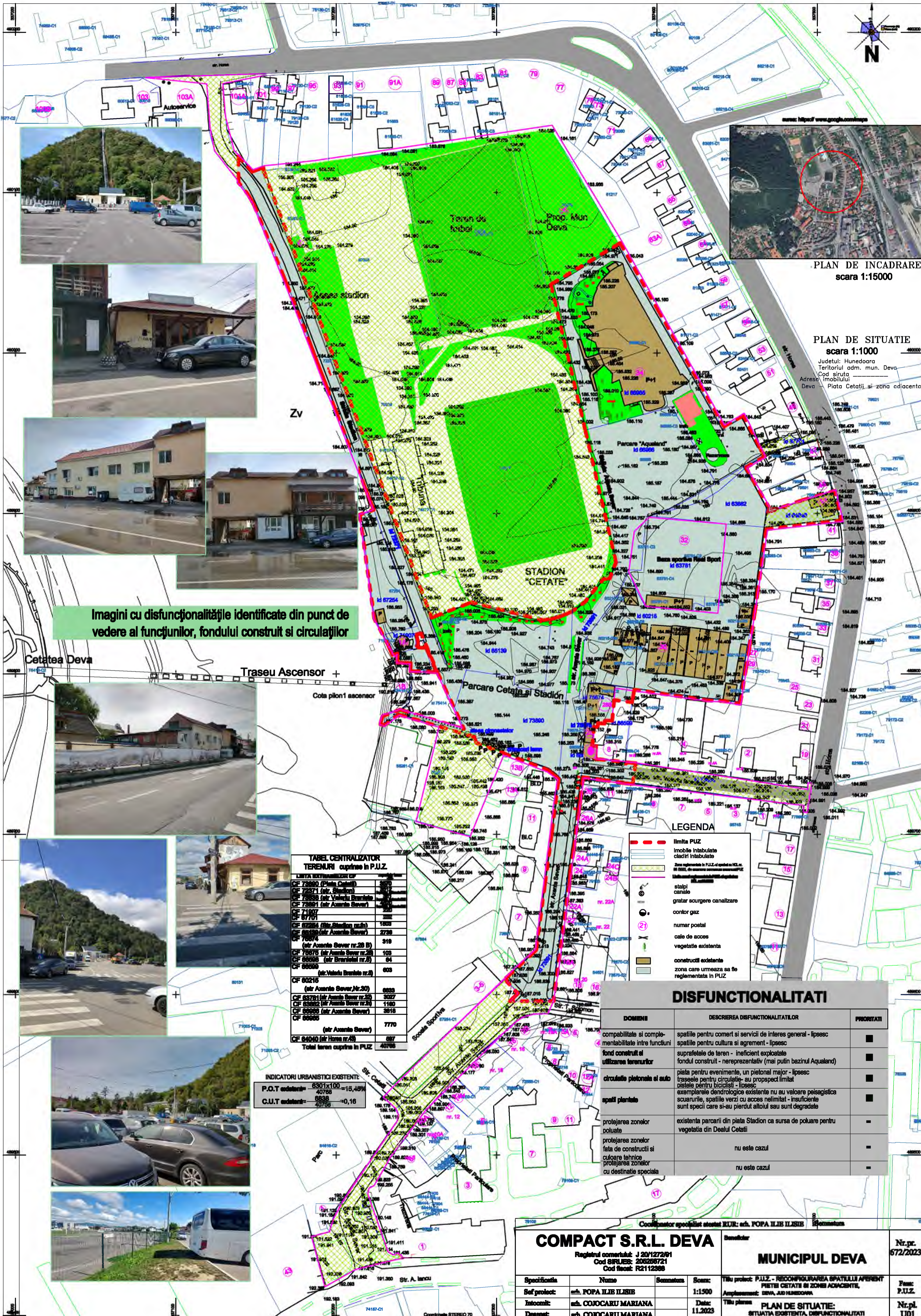
PLAN DE INCADRARE scara 1:15000