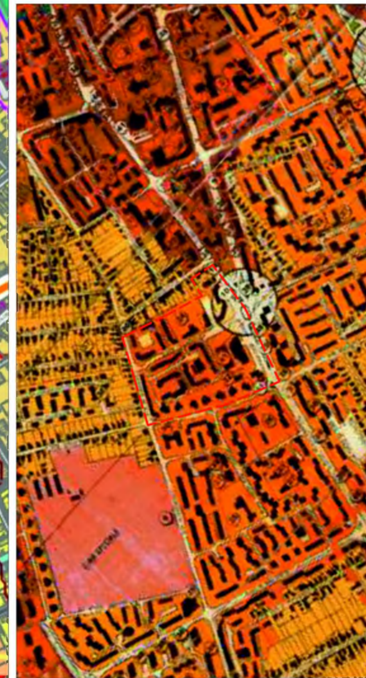
PLAN URBANISTIC GENERAL IN VIGOARE - SCARA 1:5000

Funcțiunea complementară admisă zonei este locuirea.